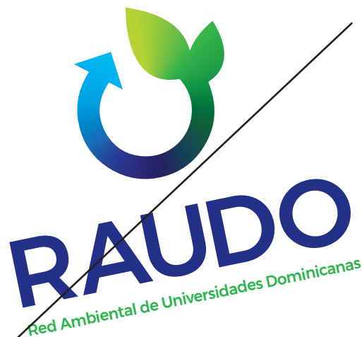
Cambiar la orientación del logotipo.