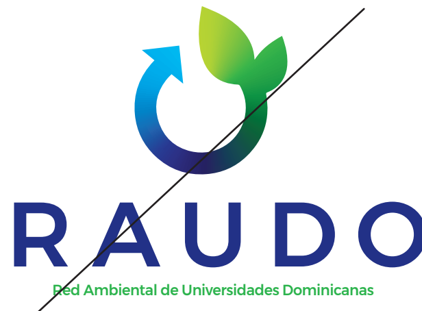
Modificar el interletrado.