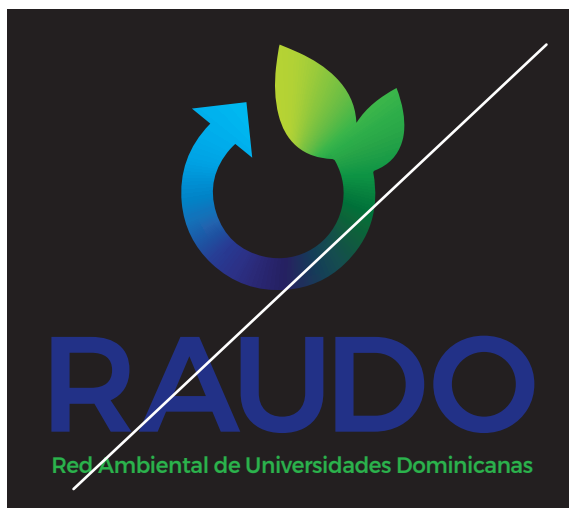
Colocar el logo en un fondo negro.