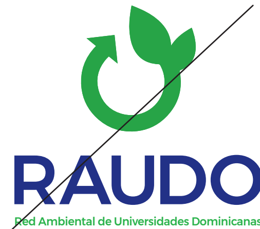
Cambiar el color de la simbología.